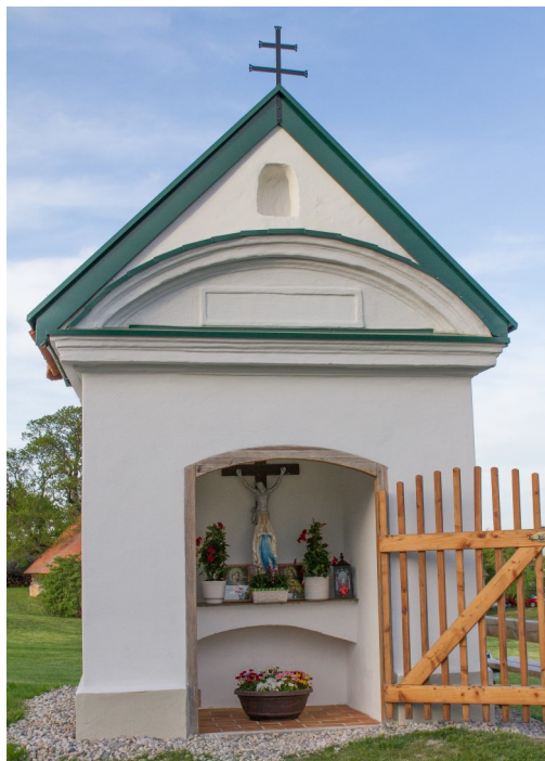
Segnung des „BINDERKREUZES“ nach der Renovierung durch die Familie Senft