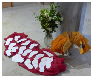
Familienmesse zur „Woche des Lebens“