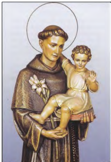
S. ANTONIO DI PADOVA prega per noi

Die Liebe zum hl. Antonius hat mir meine Großmutter ins Herz gepflanzt. Ich bete jeden Tag zu ihm und empfehle ihm besonders meine Lieben an. In Situationen, in denen man selber nichts dazu tun sondern nur machtlos zusehen kann, braucht es seinen besonderen Schutz.