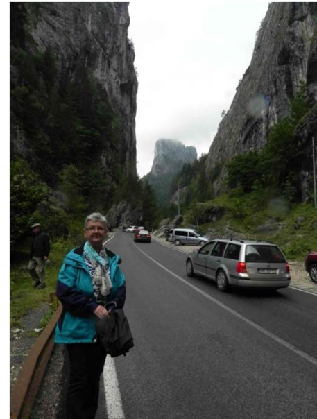
am Roten See