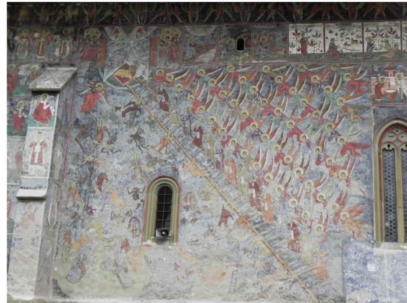
Leiter der Tugendkräfte in Sulcevita